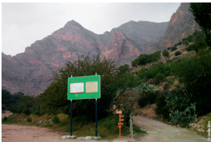
Zona de acampada Cueva Ahumada, Callosa del Segura