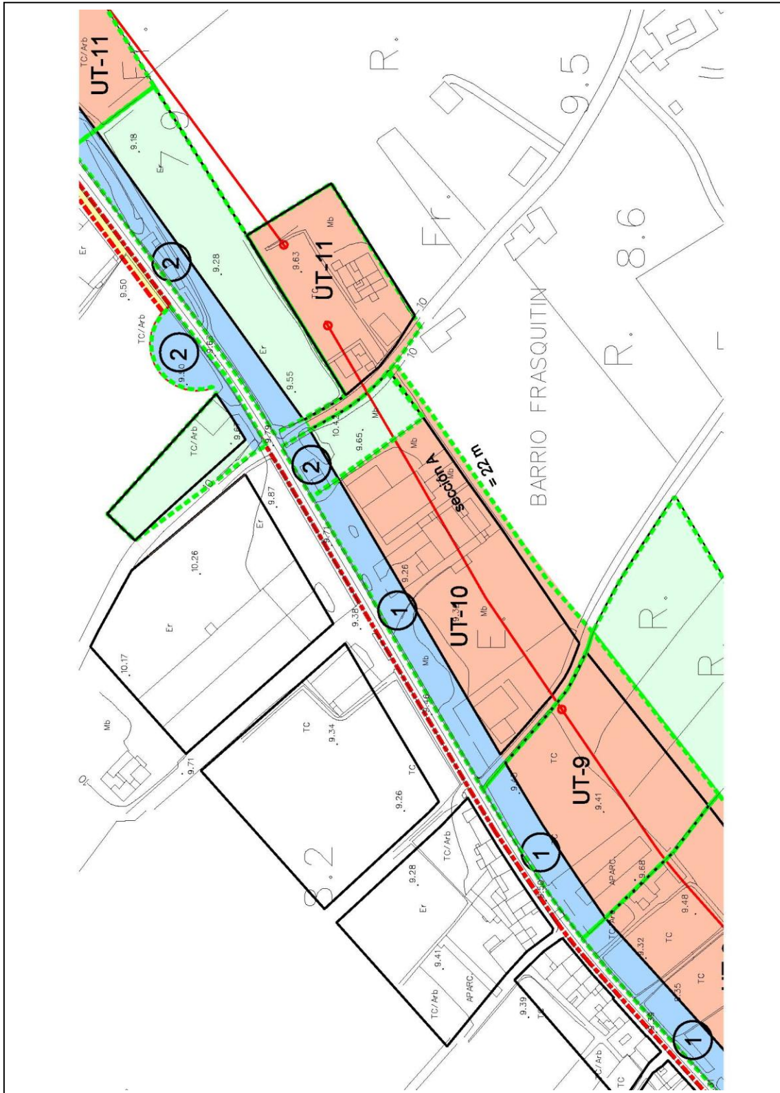
Plano de Gestión: